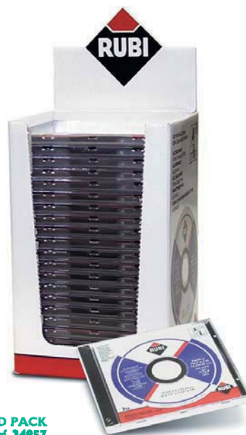
CD PACK Ref. 34957