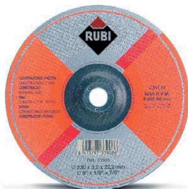
C30S / C24T