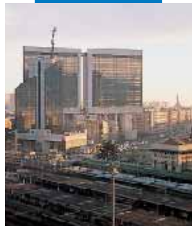
Budynek Lambruschini - Genua. - 10.000 m 2 wykładziny Liuni przyklejonej na Aquacol T