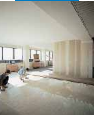
Nanoszenie kleju Aquacol T na dużej powierzchni