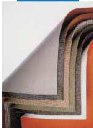
Wykładziny, które można przykleić na Aquacol T