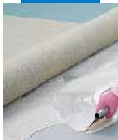
Nanoszenie kleju Aquacol T przy montażu linoleum