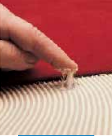
Ciągliwość kleju Aquacol T