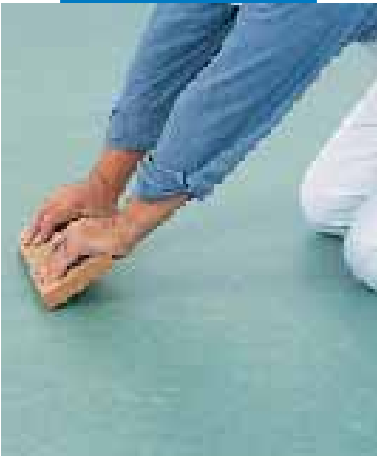
Wyglądanie złącza na wykładzinie z linoleum