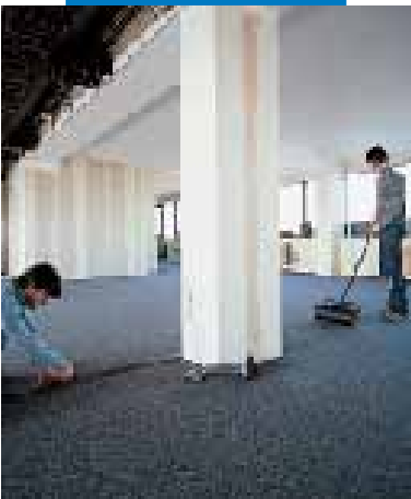
Wyglądanie wałkiem łącz wykładziny dywanowej