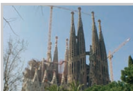
Sagrada Família, Barcelona