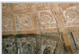
Musée d'Art et d'Histoire, St. Denis