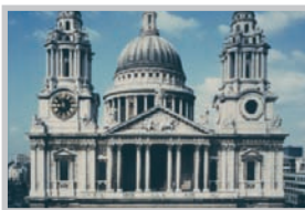
St. Oaul's Cathedral, London