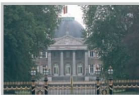
Royale Palace, Brüssel