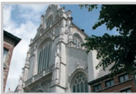
St. Paul's Church, Antwerpen